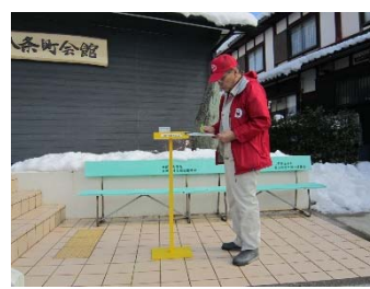
・地区内の巡回活動(放射線量測定)