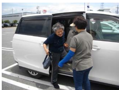
・きんたろうサポート会発足(買い物ツアー支援)