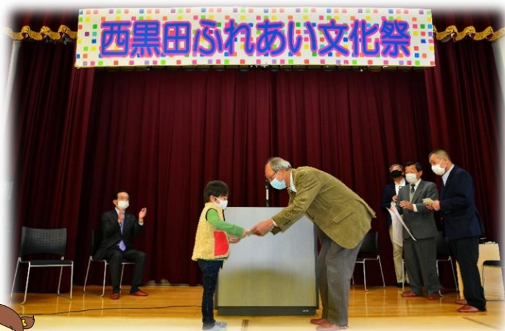
金太郎絵画展の表彰式と 入選されたみなさん