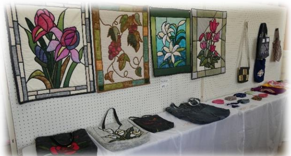
サークルさんと一般の方がたくさん作品を展示してくださいました。