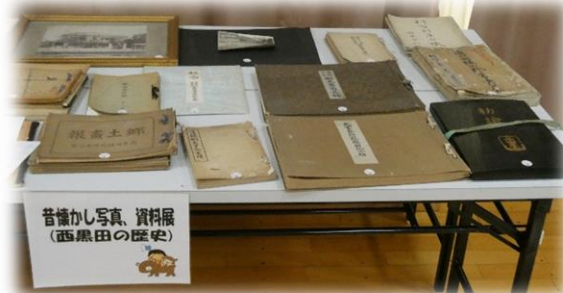
昔懐かし写真、資料展