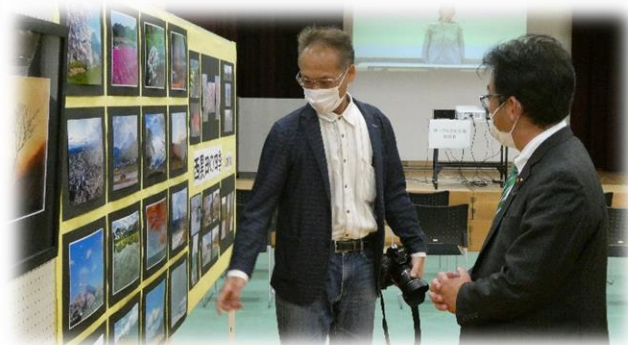
「西黒田の四季 写真展」の様子