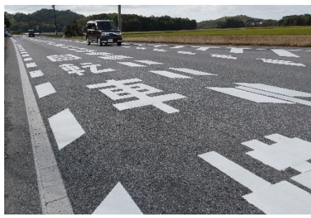
令和 2. 11/6 撮影