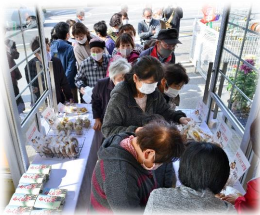
西黒田まちセンで収穫したさつま芋で作った、石焼き芋(シルクスイート)は、たくさんお買い上げいただきました。