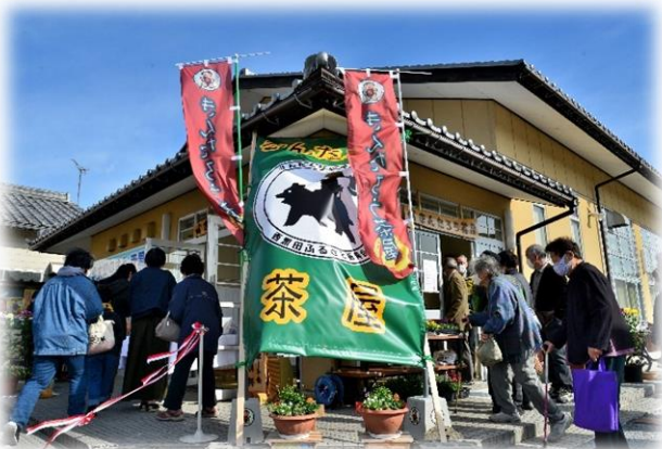
賑わう「きんたろう茶屋」と 「軽トラ市場」の様子