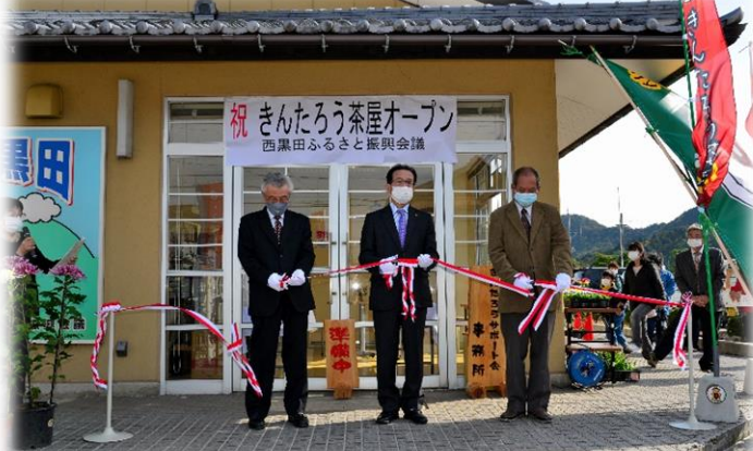
「きんたろう茶屋」オープンです