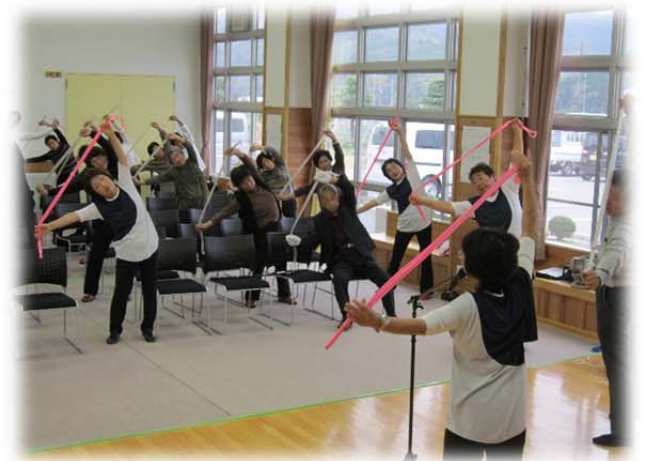
参加者全員による3B体操

11月1日(土)・2日(日)の2日間、西黒田公民館において「西黒田ふれあい文化祭」が開催されました。両日開催の常設展示では、菊花展や絵手紙・生け花・書道・手芸・文芸・水墨画、一般展示として、写真・彫刻・掛け軸・手芸や、春に開催された、レディース講座『魔法の鉢』など、各サークル会員の皆さんの力作が展示され、多くの地域内外の人が鑑賞されました。