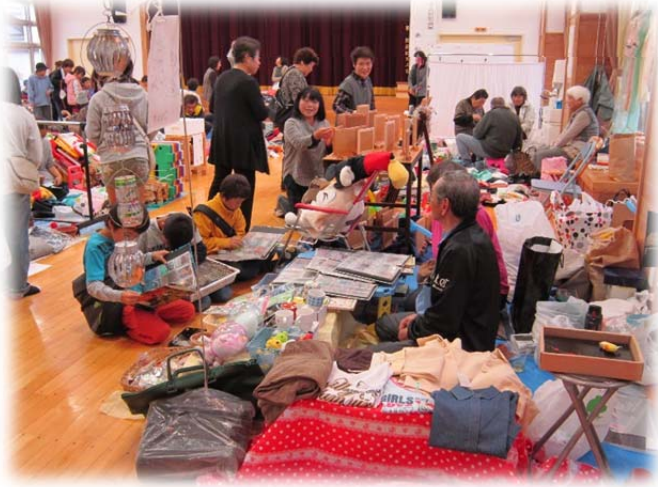
来客で賑わうフリーマーケット