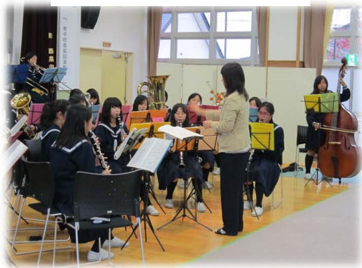
南中吹奏楽部の演奏会