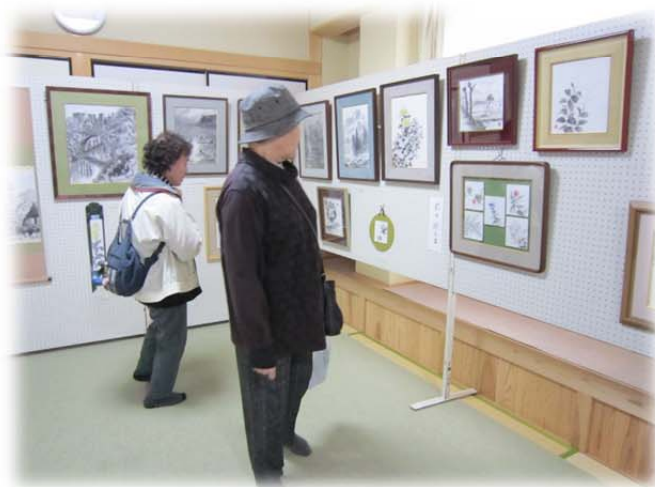
各サークル展示コーナー