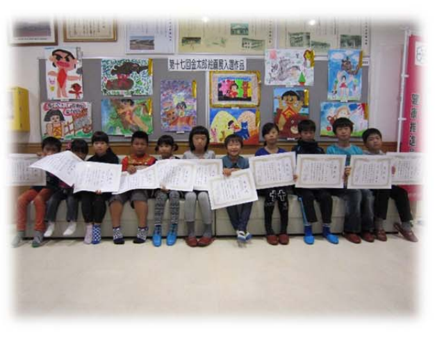
金太郎絵画展の入選作品と入選したちびっこ達